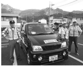
旭町会青色防犯パトロール隊