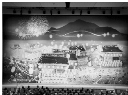
新ホールに合わせリニューアルした緞帳

ホールの緞帳は、旧市民会館で使用していたものを、新しい舞台に合わせリニューアルしたものを太平洋セメント株式会社様、秩父太平洋セメント株式会社様にご寄贈いただきました。