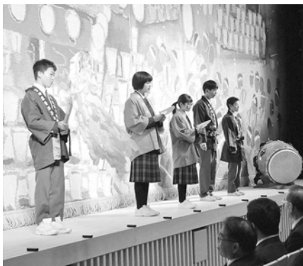
吉田中生徒による口上

式典の最初は、久喜市長の式辞です。式辞の最後には「この施設は秩父市民一人一人のものであり、これから100年間、皆さま