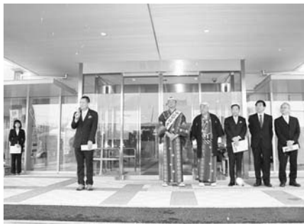
秩父祭中近笠鉾特別公開 オープニングセレモニー