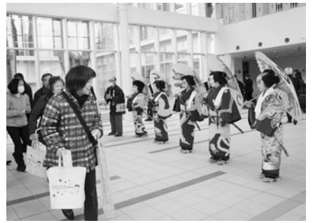
花の木小歌舞伎クラブが来場者をお出迎え

午後0時15分、いよいよ開式です。オープニングは秩父屋台囃子の勇壮な演奏で始まりました。