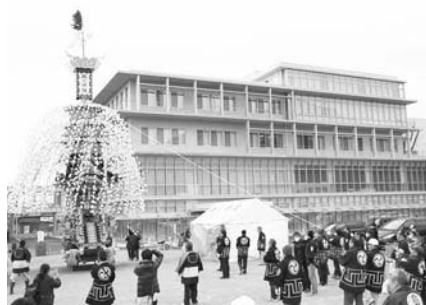
三層の花笠を付けた中近笠鉾

式典に合わせて、「秩父祭の屋台行事と神楽」を含む『山・鉾・屋台行事』のユネスコ無形文化遺産登録を記念して、中近笠鉾特別公開が行われました。