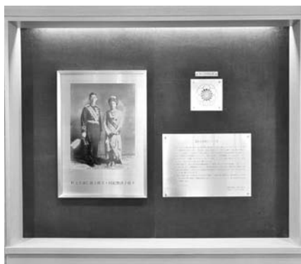
秩父宮両殿下記念プレート