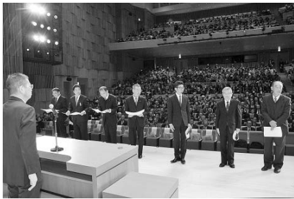
7人の代表者に表彰状・感謝状を贈呈

式典も最後となり、秩父第二中学校合唱部との全員合唱です。会場が一体となり、「秩父市歌」「旅立ちの日に」を斉唱しました。