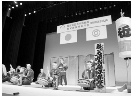
中近太鼓会による秩父屋台囃子

午後0時15分、いよいよ開式です。オープニングは秩父屋台囃子の勇壮な演奏で始まりました。