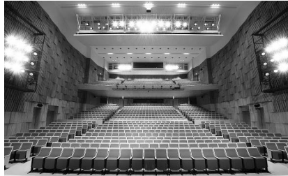
大ホール フォレスト