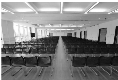
けやきフォーラム