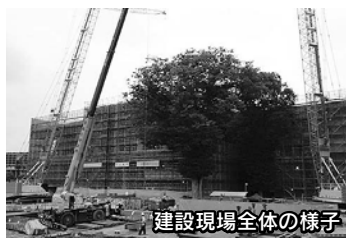
建設現場全体の様子