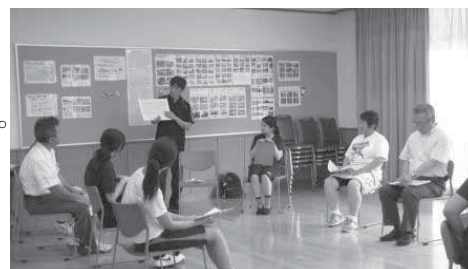
＜三校合同研修会＞ライフスキル研修 「威圧的な行動に対応するには？」