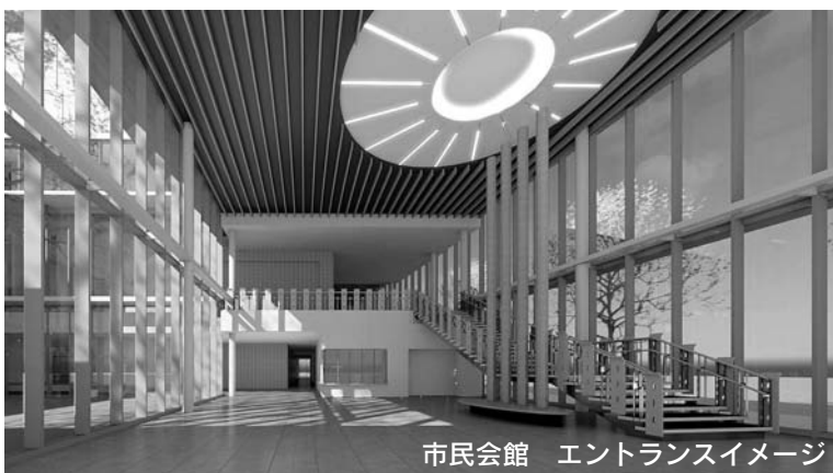
市民会館 エントランスイメージ

方、新施設の庁舎部分に、同じく歴史文化伝承館の約3,000㎡を加えた全体の面積は、約7,800㎡となり、以前より約800㎡小規模なものとなっています。 なお、本庁舎と歴史文化伝承館内の職員数（平成28年度見込）から計算した庁舎必要面積（国土交通省基準）は約10,800㎡となり、この面積からは約3,000㎡小規模なものとなります。 新施設は限られた面積の中で、歴史文化伝承館の本来の庁舎部分と併せて、有効活用する計画としています。