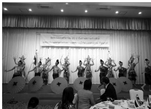
タイ伝統人形劇「フン・ラコーン・レック」

10月の龍勢祭には、ヤソトン市からの交流団をはじめとして、タイ国政府観光庁の方々等、タイ王国関係者107人にお越しいただき、秩父吉田ヤソトン会の方々を中心に交流を深めました。また、今年は龍勢国際交流会に、在京タイ王国大使館のパットラット・ホントン公使参事官にもご出席いただきました。