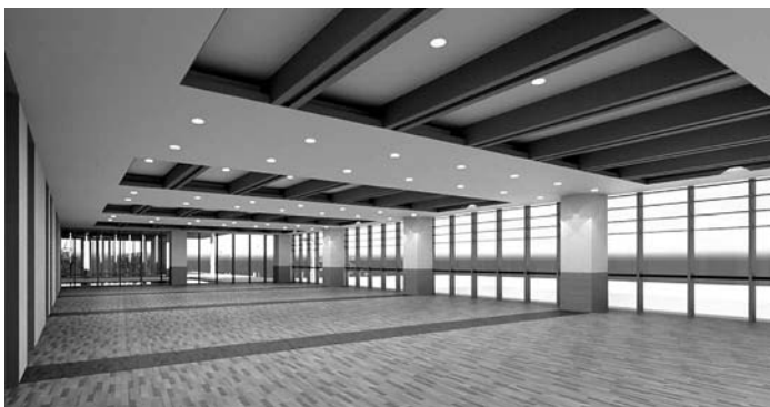
市民会館大会議室（仮称）ケヤキフォーラム内観イメージ

このようにやむを得ず事業費を増額することになりましたが、財源については、有利な地方債である合併特例債を増やし、国の補助事業を活用することで、公共施設整備基金の一部を残し、実質的な市の財政負担額は、事業費を増額する前の試算より、軽減する見込みでいます。 合併市町村に付与された合併特例債は、その約7割が地方交付税として交付される大変有利な地方債です。 平成32年度までの発行期限である合併特例債を活用することができなければ、実質的な市の財政負担は現在より大変大きくなります。