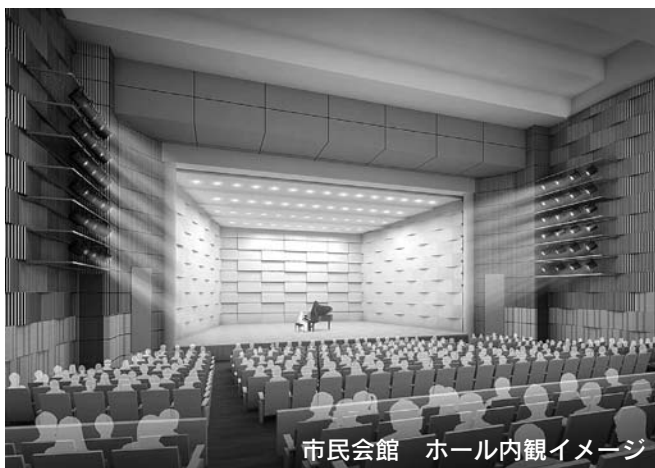
市民会館 ホール内観イメージ