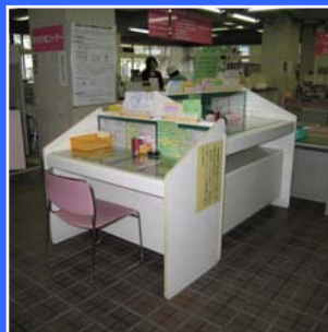
たか ちが きさいだい 高さの違う記載台