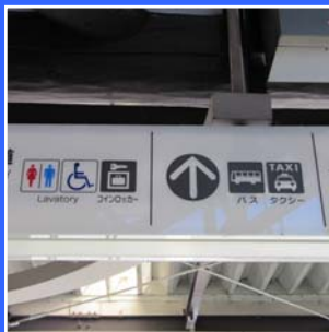
え も じ あんない 絵文字の案内サイン