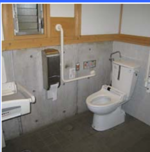
たもくてき 多目的トイレ